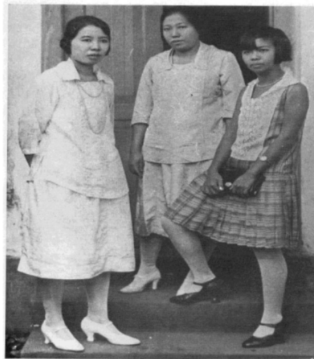
Gambar V: Wanita muda Tionghoa dengan pakaian Barat

terutama yang berorientasi ke Tiongkok, cenderung mengikuti tren pakaian yang berkiblat di Shanghai. Memasuki tahun 1920-an, wanita muda Tionghoa mulai mengikuti tren busana Barat sebagai akibat dari masuknya pendidikan di kalangan wanita. Pendidikan telah merubah cara pandang dan menempatkan wanita Tionghoa untuk memilih pakaian Barat sebagai identitasnya sebagaimana kaum adam Tionghoa. Meski demikian, hal tersebut memunculkan berbagai kritik dari kaum pria Tionghoa yang memandang bahwa busana Barat tidak sesuai bagi wanita Tionghoa. Pada majalah “Doenia Istri”, sebuah majalah khusus wanita, diilustrasikan dengan foto mengenai pakaian-pakaian bintang film Barat dan Cina yang berambut pendek dan menggunakan pakaian yang cenderung ‘berani’ dan terbuka. (Sidharta, Scholten (eds), 1987: 67).