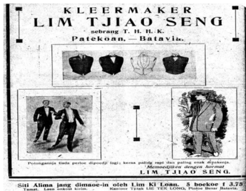
Gambar VII: Iklan toko jas milik orang Tionghoa (Sumber: Hanpo , Selasa 29 Tjagwe 15 Desember 1914, Taon ke I, No. 4)