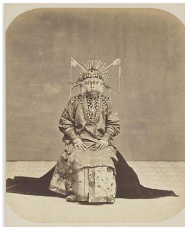
Gambar III: Pengantin dengan pakaian tradisional Cina, Batavia 1870

Kebanyakan bagi wanita Tionghoa muda memakai pakaian berwarna merah muda atau hijau; yang setengah tua memakai kain berwarna sawo matang, biru, atau ungu; dan bagi wanita yang telah berumur memakai kain berwarna hitam. Kain yang dipakai adalah kain sutera mahal yang didatangkan dari Tiongkok. Budaya penggunaan pakaian tradisional Cina juga sangat tampak ketika mereka akan mengadakan pernikahan dengan adat tradisional yang disebut dengan Ciotao , suatu tata cara perkawinan tradisional yang dibawa oleh imigran abad XVII dari Cina Tenggara yang masih dilakukan di Batavia (Gondomono, 1996: 57). Dalam upacara tersebut calon mempelai menggunakan pakaian tradisional Cina. Bagi mempelai yang memang berasal dari kalangan berada menggunakan selendang akan digubah dengan perhiasan intan permata dan memakai sepatu sulaman dari bahan yang benar-benar emas ( kimchong ). Lebar selendang itu sekitar 25 cm dan panjang 40 cm, cara memakainya dengan disampirkan di bahu. Anak-anak dari kalangan elite tradisional Cina pun tidak luput dari penggunaan pakaian tradisional Cina, karena pada masa tersebut merupakan jenis pakaian yang dipandang terbaik. Tidak jarang anak-anak tersebut lebih menyerupai boneka karena dandanannya yang terkesan berlebihan (Tjoe, 2004:141).