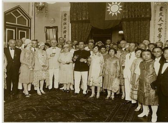
Gambar VI: Resepsi konsulat jenderal Tionghoa, Chang Ming, di Batavia 1929

'berani' menggunakan warna putih karena pada awalnya warna tersebut merupakan warna yang identik dengan warna pakaian orang Eropa, namun sekarang mulai digunakan oleh kalangan elite Tionghoa. Pakaian ini juga kerap digunakan dalam acara-acara resmi pertemuan dengan pemerintah kolonial, gala makan malam suatu komunitas, pertemuan bisnis, seragam sekolah elite Tionghoa dengan kurikulum Eropa, maupun sebagai dresscode resmi untuk menyambut tamu agung, salah satunya adalah resepsi Konsulat Jenderal Tionghoa, Chang Ming, di Batavia 1929.