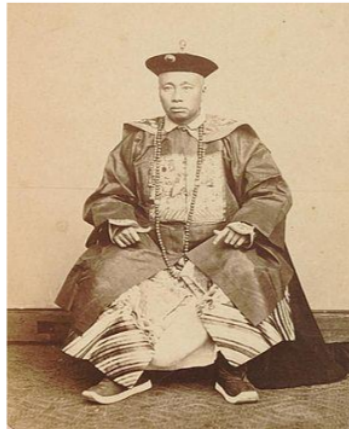
Gambar II: Elite Tionghoa Batavia dengan baju kebesarannya,1870

Kebanyakan bagi wanita Tionghoa muda memakai pakaian berwarna merah muda atau hijau; yang setengah tua memakai kain berwarna sawo matang, biru, atau ungu; dan bagi wanita yang telah berumur memakai kain berwarna hitam. Kain yang dipakai adalah kain sutera mahal yang didatangkan dari Tiongkok. Budaya penggunaan pakaian tradisional Cina juga sangat tampak ketika mereka akan mengadakan pernikahan dengan adat tradisional yang disebut dengan Ciotao , suatu tata cara perkawinan tradisional yang dibawa oleh imigran abad XVII dari Cina Tenggara yang masih dilakukan di Batavia (Gondomono, 1996: 57). Dalam upacara tersebut calon mempelai menggunakan pakaian tradisional Cina. Bagi mempelai yang memang berasal dari kalangan berada menggunakan selendang akan digubah dengan perhiasan intan permata dan memakai sepatu sulaman dari bahan yang benar-benar emas ( kimchong ). Lebar selendang itu sekitar 25 cm dan panjang 40 cm, cara memakainya dengan disampirkan di bahu. Anak-anak dari kalangan elite tradisional Cina pun tidak luput dari penggunaan pakaian tradisional Cina, karena pada masa tersebut merupakan jenis pakaian yang dipandang terbaik. Tidak jarang anak-anak tersebut lebih menyerupai boneka karena dandanannya yang terkesan berlebihan (Tjoe, 2004:141).