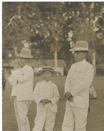
Gambar IV: Siswa Hollandsche Chinese School (HCS) di Batavia, 1905