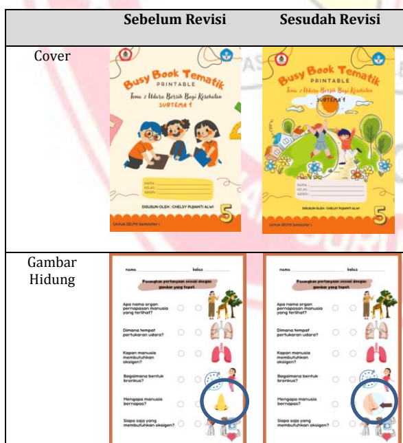
Tabel 3. Desain Media Busy Book Sebelum dan Sesudah Revisi

Pada tahap ini masukan atau saran perbaikan dari validator/ahli ditindaklanjuti dengan perbaikan desain produk agar media yang dihasilkan efektif dan dapat digunakan. Berdasarkan penilaian validator ahli media terdapat revisi yaitu cover lebih baik disamakan dengan judul, gambar hidung sebaiknya asli, dan terdapat kesamaan judul pada pembelajaran SBdP.