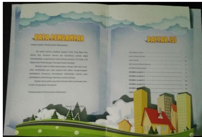
Gambar 3. Halaman Kata Pengantar dan Daftar Isi

Pada bagian ini menggunakan bahan terbuat dari kertas ivory 310gram dengan ukuran pop up bagian daftar isi dan kata pengantar yakni 31 cm x 47 cm. Pada bagian kata pengantar dan daftar isi dibuat menggunakan latar belakang ilustrasi gambar gedung dengan suasana pegunungan dan berawan yang menarik untuk disajikan.