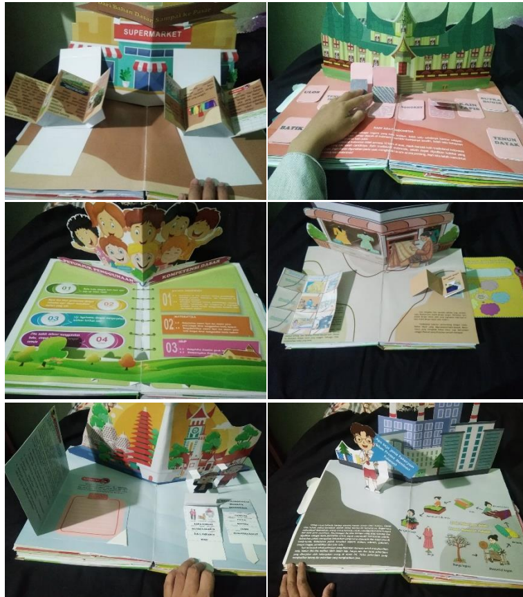
Gambar 4. Isi Materi