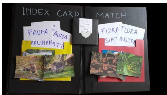
Gambar 3 Scrapbook Sesudah Revisi